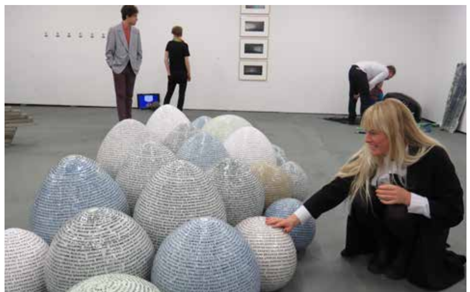
Margir listamenn sækja innblástur til Djúpavogs. Myndin er frá sýningunni Rúllandi snjóbolti sem fór fram dagana 13. júlí-8. ágúst í sumar.